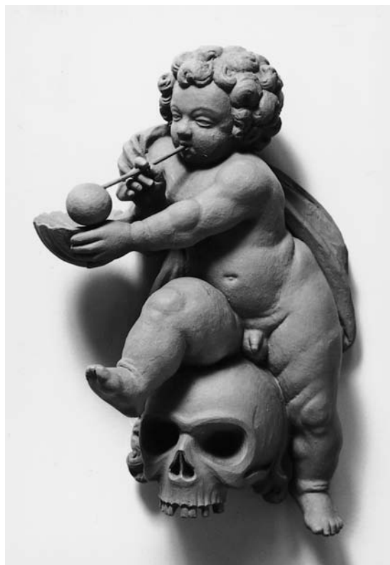
Fig. 17. Putto, der blæser sæbebobler, fra (†)epitafium o. 1700 (s. 6352). I Horsens Museum. – Putto blowing soap bubbles, from (†)memorial tablet, c. 1700.

Grinder-Hansen 1980 (olielampe); Jens Bergild 2005 (dåbsgruppe, englefigurer, maleri af Den vantro Thomas, karyatidehermer); (Hugo Johannsen 2006 (røggelsekar, salmenummertavle). – Redaktion ved Hugo Johannsen.