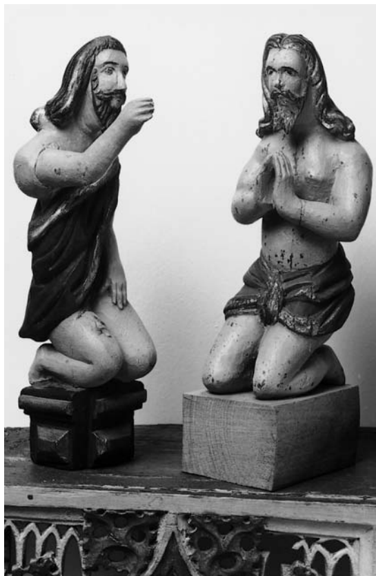
Fig. 4. Jesus og Johannes Døberen fra (†)fontehimmel o. 1650 (s. 6346). I Horsens Museum. – Jesus and John the Baptist from (†)font canopy c. 1650.

og Johannes' kappe afsluttes bagpå med knude og snip. Johannesfigurens ene arm og ben er fornyet. – Stafferingen er nyere med okkergul hudfarve, sort hår og skæg samt brunfarvet lændeklæde og kappe. Konsollen under Johannes er blå med guld på bosses og kanteliste, ligesom klædedragt og hår markeres med striber af guld.