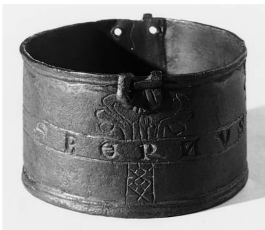
Fig. 1. Oblatæske o. 1250, signeret af »Esbernvs Benedi(cti)«, d.e. Esben Bendtsen (s. 6345). I Horsens Museum. – Wafer box , c. 1250, signed by »Esbernvs Benedi(cti)«, i.e. Esben Bendtsen.

Pyksis (hostiebeholder) (fig. 1), o. 1250, af bronze. Æsken til opbevaring af den indviede hostie er cylindrisk, 5,6 cm i tværmål og 3,6 cm høj. Den har profileret kant foroven og forneden samt midtpå et bånd, hvori med graverede majuskler læses efter et kors: »Fecit Esbernvs Benedi(cti)« (Esben Bendtsen gjorde (mig)). 1 Foruden båndet prydes legemet af et indgraveret, tre gange