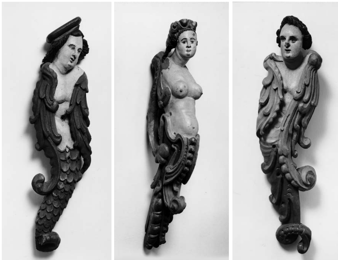
Fig. 15a-c. Karyatidehermer o. 1675 fra (†)epitafium (s. 6352). I Horsens Museum. Foto NE 1980. – Caryatid herms, c. 1675, from (†)memorial tablet.