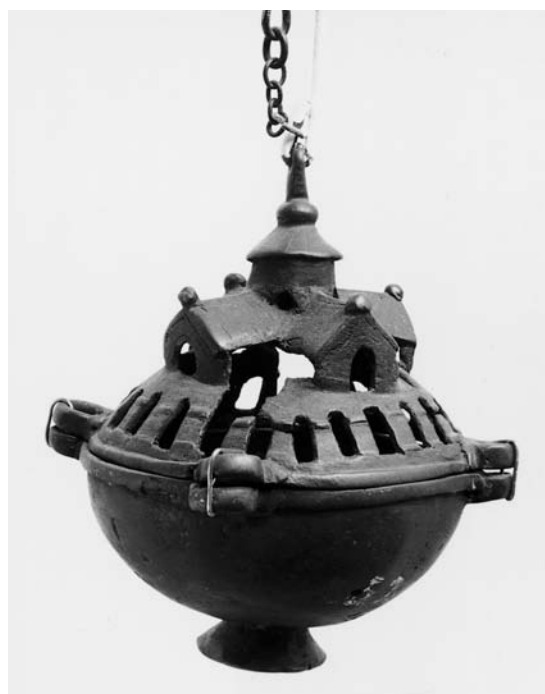
Fig. 2. Røgelseskar, romansk (s. 6345). I Horsens Museum. – Censer, Romanesque .

gentaget stiliseret træ med krydsskraveret stamme og blade, der breder sig ud over indskriftbåndet. En lille bladformet plade er to steder fastgjort til mundingsranden, diagonalt over for hinanden; hertil har det forsvundne †låg været fastgjort med øskener. Sidestykker til det sjældent forekommende hostiegemme, muligvis udført i samme værksted, opbevares i Ribe (Antikvarisk Samling) og Flensborg (Bymuseum, tidligere Hjerpsted Kirke) ( DK Ribe 862, 3531; DK Sjyll 1393). I Horsens Museum (inv.nr. HOM 1×9412).