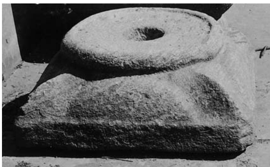
Fig. 3. Fod fra romansk font (s. 4346). I Nationalmuseet. – Base of Romanesque baptismal font.

Fragmenter fra (†)fontehimmel, o.1650. To træskårne figurer (fig. 4), ca. 34-35 cm høje, forestillende Jesus og Johannes Døberen, knælende på hver sin konsol; sidstnævnte udgøres i Jesu tilfælde af en nyere klods, mens figuren af Johannes Døberen har bevaret den oprindelige konsol med diamantbosses og pynteliste. Jesus er vist i bedestilling, Johannes velsignende, og begge figurer har langt krøllet hår og skæg. Jesu lændeklæde