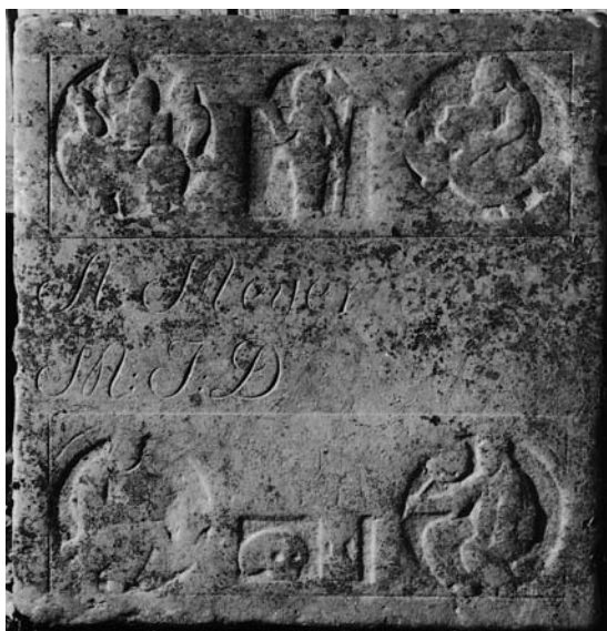
Fig. 16. Gravflise o. 1675 med sekundær indskrift (s. 6352). I Horsens Museum. – Tombstone, c. 1675, with secondary inscription.

NM. Indberetninger ved Vibeke Michelsen 1980 (pykiss og klingpung); Jens Jørgen Frimand 1980 (Kristusfigur, malerier af Korsfæstelsen og Opstandelsen); Poul