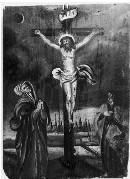
Fig. 13. Kristus på korset, 1700'erne. Maleri fra altertavle(?), pulpitur(?) eller epitafium(?) (s. 6349). I Horsens Museum. – Christ on the Cross, 1700s. Painting from altarpiece(?), gallery(?) or memorial tablet(?) .

Kristus er vist som verdensfrelser ( Salvator Mundi ) med højre hånd løftet i velsignelse og holdende rigsæblet i den fremstrakte venstre, som er påsat for sig. Det kraftige korte hår danner en