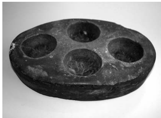
Fig. 10. Olielampe, romansk (s. 6349). I Horsens Museum. – Oil lamp, Romanesque.

Den korsfæstede Frelser flankeres af Maria og Johannes. I baggrunden Jerusalem, vist som en nordeuropæisk by med talrige kirketårne og -spir. Mellem Golgatha og byen løber Kedrons bæk(?), som krydses af en træbro. På korset en seddel med Jesumonogrammet, skrevet med store