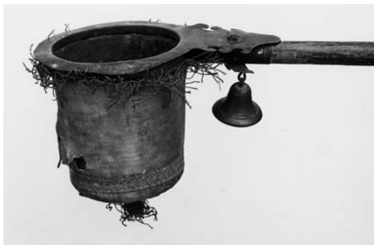
Fig. 9. Klingpung, 1700'erne (s. 6349). I Horsens Museum. – Coin purse, 1700s.

Klingpung (fig. 9), 1700-tallet, af messing med træskaft og betræk af fløj. Pungen, 10 cm i tværmål, har påsat, ombukket rand, der er trukket ud i fliget plade. Beholderen er udvendig betrukket med falmet, nu brunligt fløj med guldgalonier, der langs randen har frynser og under bunden en kvast. Den fligede plade er nittet til skaftets nedre messingmuffe, på hvis underside er en tværstillet plade med øskener til (messing)klokker; kun den ene af disse er bevaret. Det grønmalede, 116 cm lange skaft har drejet, sortmalet håndtag. Muligvis fra Gangsted Kirke. I Horsens Museum (inv.nr. HOM 1×9326).