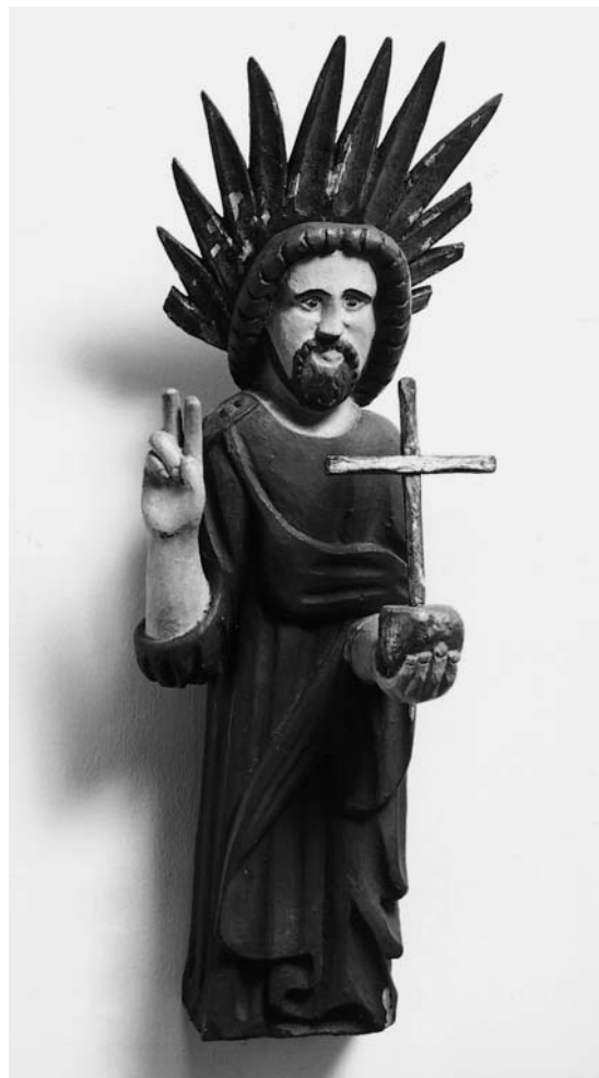
Fig. 14. Kristus som Salvator Mundi , 1600'erne, antagelig topfigur fra altertavle eller epitafium (s. 6351). I Horsens Museum. Foto NE 1980. – Christ as Salvator Mundi, 1600s, probably top figure from an altarpiece or memorial tablet .

brømme omkring hovedet, til hvis bagside en glorie med hulede stråler er fæstnet med skruer. Den massive figur er meget groft skåret, og kjortelen, som er lukket med knapper ved højre skulder, falder i tunge folder. I ryggen og under fodpladen er taphuller til fastgørelse.