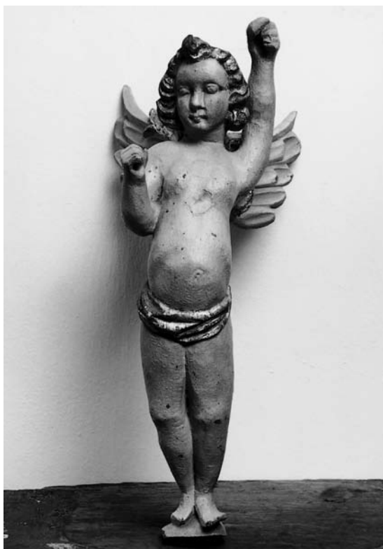
Fig. 5. Englefigurer o. 1650 fra (†)fontehimmel(?) (s. 6346). I Horsens Museum. – Angel figures, c. 1650, from (†)font canopy(?) .

Fragmenter af stol (fig. 6-8), o.1500. Stolen, der er sekundært sammenstykket, består af to indbyrdes forskellige gavle, et rygpanel samt et øget sædebræt, alt på nyere fodstykke.