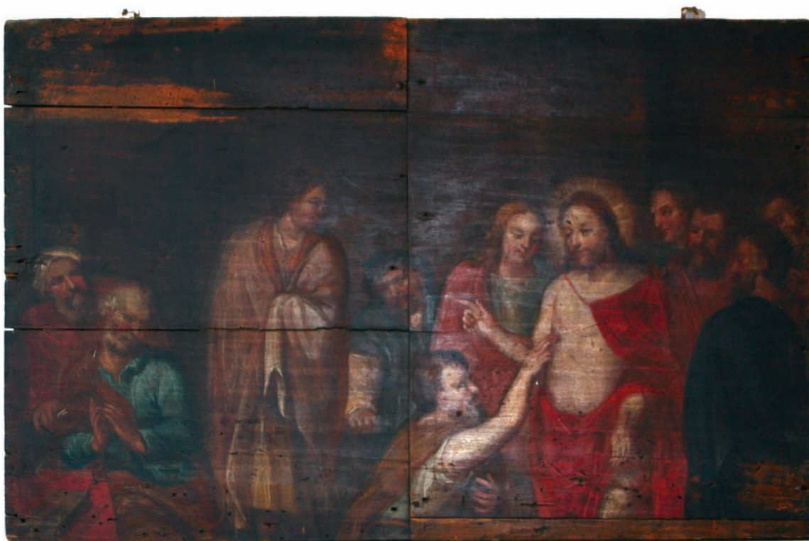
Fig. 11. Den vantrø Thomas. Maleri, tilskrevet Hans Christian Wilrich og muligvis fra pulpiturbrystning o. 1700 (s. 6349). I Horsens Museum. – Doubting Thomas. Painting attributed to Hans Christian Wilrich and possibly from gallery parapet c. 1700.