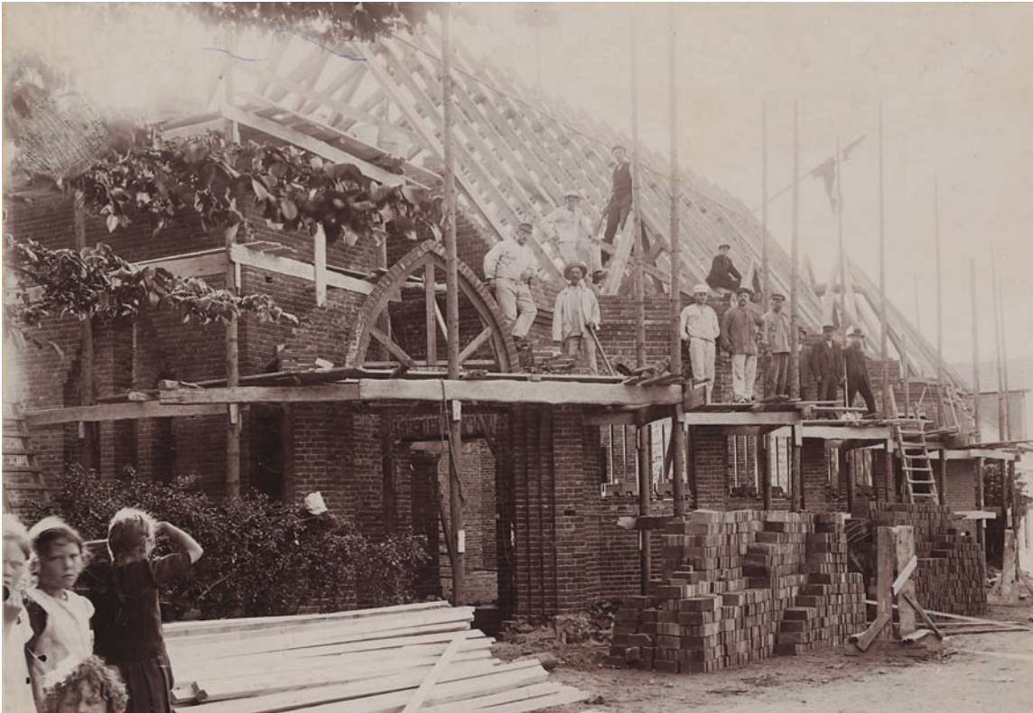
Fig. 2. Rejsegilde 1912. – Topping-out ceremony 1912.

Omgivelser. Vest for kirken er der have for præst og menighed, mens der er parkering foran den