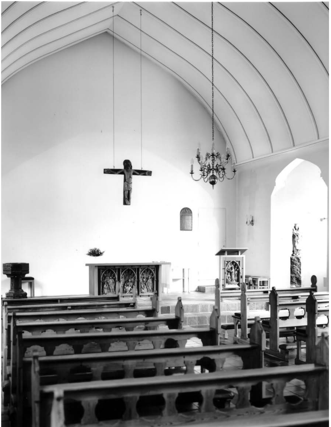
Fig. 7. Indre set imod alteret. – Interior towards the altar.