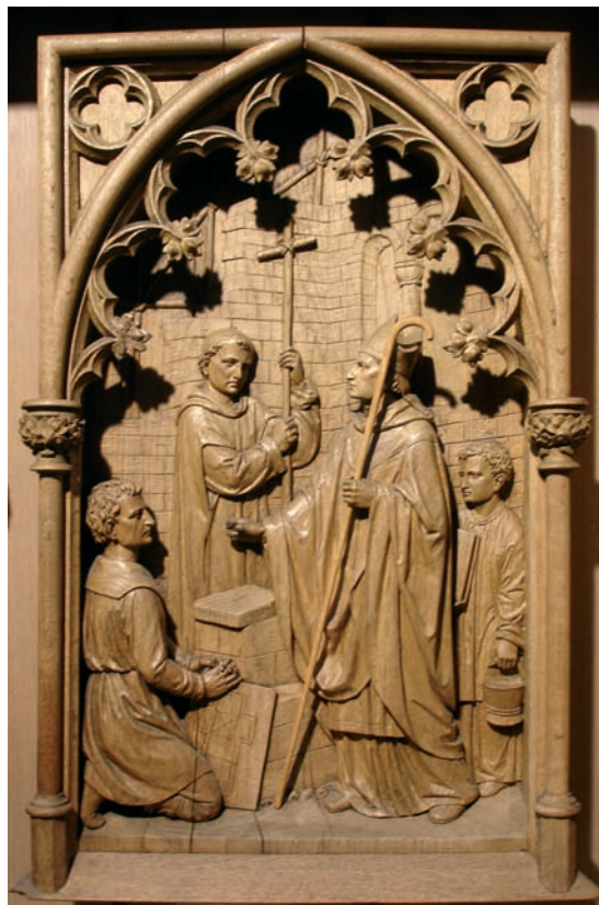
Fig. 8. Skt. Ansgar lader en kirke bygge, vel Danmarks første i Hedeby. Relief på alterbordet, udført 1886 af billedskærer Fleige i Münster (s. 6305). – St. Ansgar builds a church, probably the earliest in Denmark at Hedeby. Relief on altar, 1886.

Altersølv. Kalk. 1) 1898 eller før, udført af en guldsmed i Paderborn og derfor utvivlsomt bragt med af Den kristelige Kærligheds Søstre. Kalken er 20 cm høj, historicerende, med lav klokkeformet fod og svajet bæger, der har rester af forgyldning. Skaftledene er formet som tønder (udbugende) med bladværk og indfattede perler, der også pryder knoppen. På fodens underside læses guldsmedens signatur: »J. Fuchs fec(it) Paderborn«.