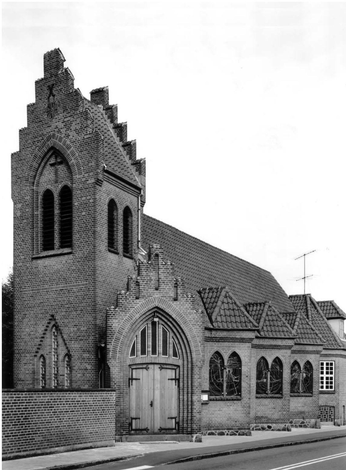
Fig. 1. Kirken set fra sydøst. – The church seen from the south east.