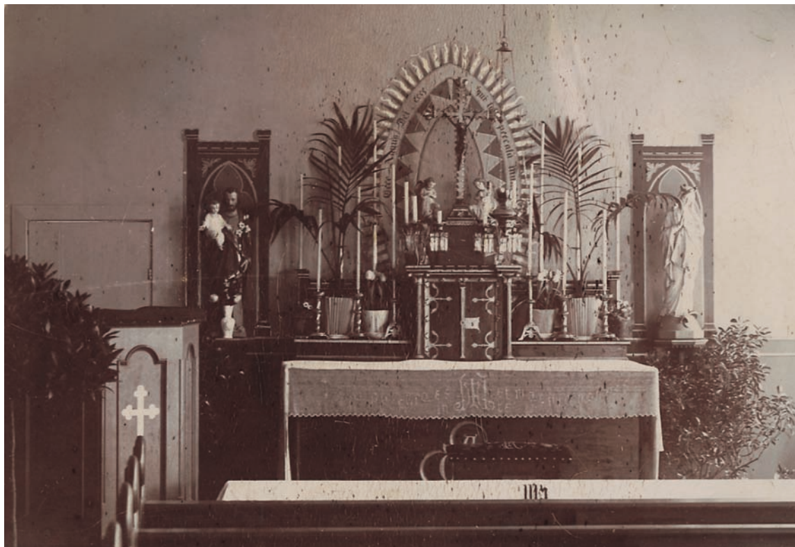
Fig. 9. Indre af det katolske \dagger kapel fra 1898. – Catholic \dagger chapel of 1898, interior.

Monstrans , formentlig fra 1912, messing, 60 cm høj, en standardvare i gotisk stil med frifigur af Kristus stående med udbredte arme oven på selve oblatbeholderen (ostensoriet).