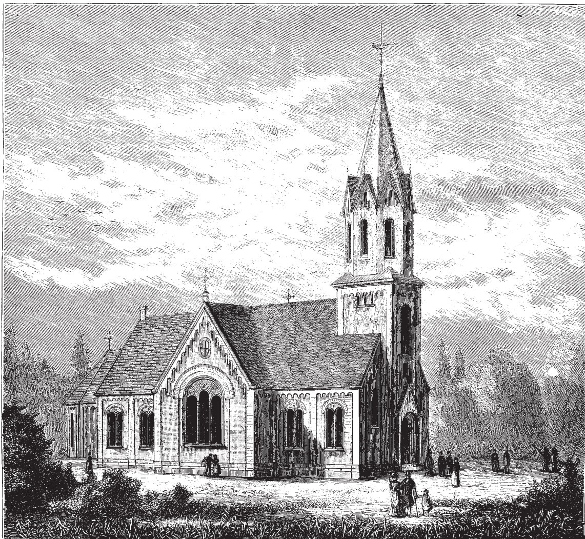
Fig. 3. »Den nye Kirke i Silkeborg, opført af Architect H. Sibbern«. Efter stik i Illustreret Tidende 1876. – The new church at Silkeborg as presented in Illustreret Tidende 1876.

(fig. 2E), opført efter tegning af arkitekt Vilhelm Olsen, Holbæk. Ved metodistmenighedens opløsning 1997, blev kirkebygningen afhændet, og den tjener nu kontorformål.