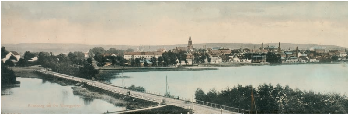
Fig. 1. Silkeborg set fra nord 1923. Midt i billedet rager Silkeborg kirke op, og til højre derfor anes tårnstilladset af metodistkirken Vor Frelsers under opførelse. Tv. ses Gudenåens udløb og yderst lidt af holmen, hvor den middelalderlige borg med \dagger kapel stod. I forgrunden dæmningen til Alderslyst, hvis kirke opførtes 1929. – View of Silkeborg from the north 1923.