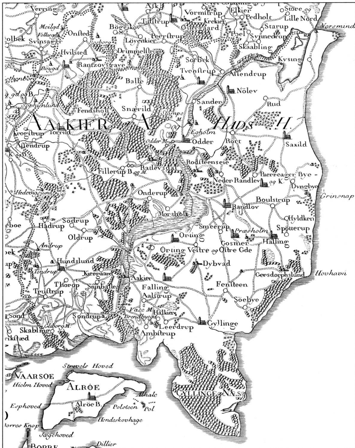
Hads herred 1:120000 (originalens målestok). Udsnit af Videnskabernes selskabs kort over Haureballegaard m.fl. amter, tegnet 1787, stukket 1789. Det frugtbare område (1961: ialt 22936 ha) ligger på nordsiden af Horsens fjord og gennemskæres af dalsænkningen, der fra fjorden i syd strækker sig over Åker og Odder til Kysing fjord med udløb i Kattegat ved Norsminde. Af herredets 19 middelalderlige kirker er 14 bevaret. - Map of the Hads district 1789.